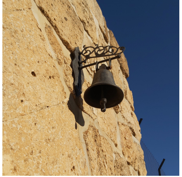
Çanlarımı kendim için/de çalıyorum.