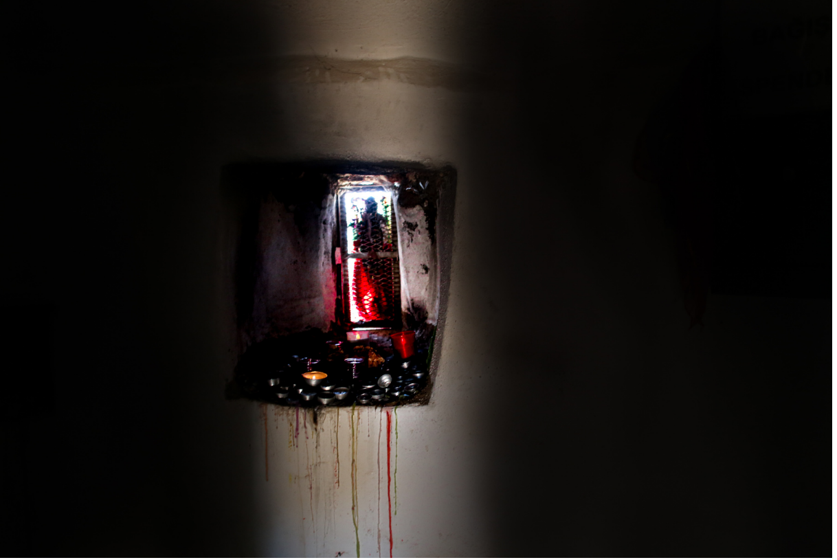
Ađıt: Eriyen mum izleri, inançları yüzünden kan ve gözyaşı döken insanların yakarıřları.